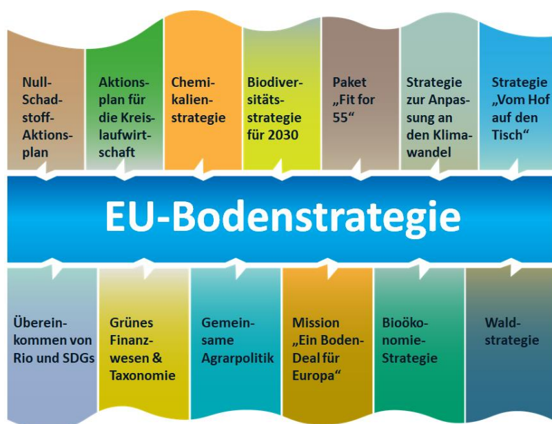
Abbildung 1: Verbindungen zwischen der EU-Bodenstrategie und anderen EU-Initiativen