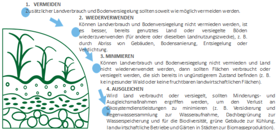
Abbildung 2: Flächenverbrauchshierarchie